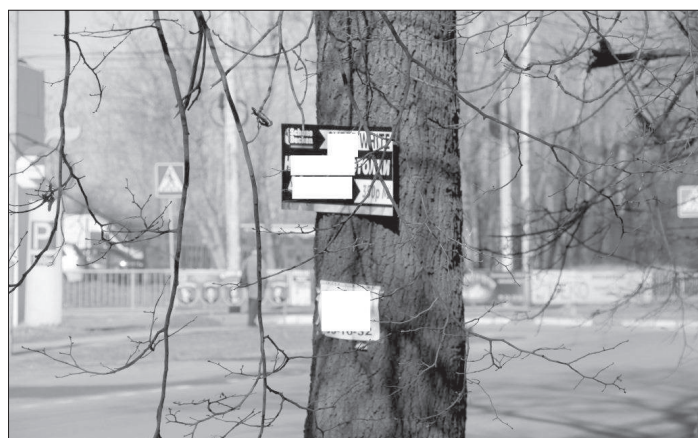
Количество незаконной рекламы на улицах Калининграда не уменьшается.

Дважды в неделю сотрудники городского отдела рекламы совершают выезды, проводя на калининградских улицах мониторинг на пред-