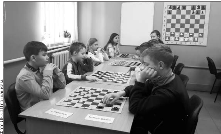
Шашки соревновались по швейцарской системе в семь туров.

Агентство по спорту наградило призеров кубками, медалями, дипломами. Победитель турнира Гурьевская гимназия получила путевку на финал в «Орленок».