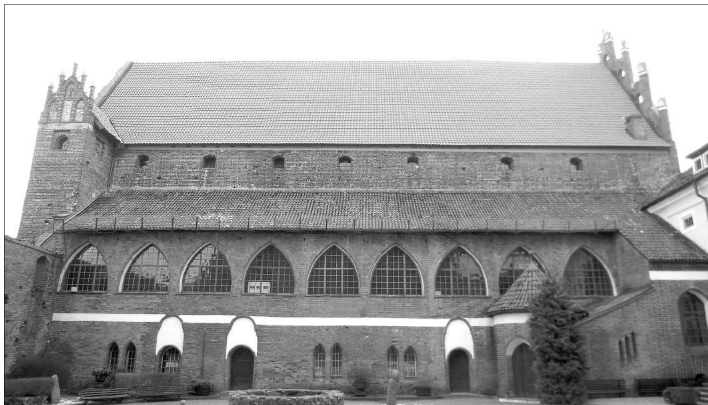
Внутренний дворик Ольштынского замка.

И делал он это, надо отметить, вполне успешно.