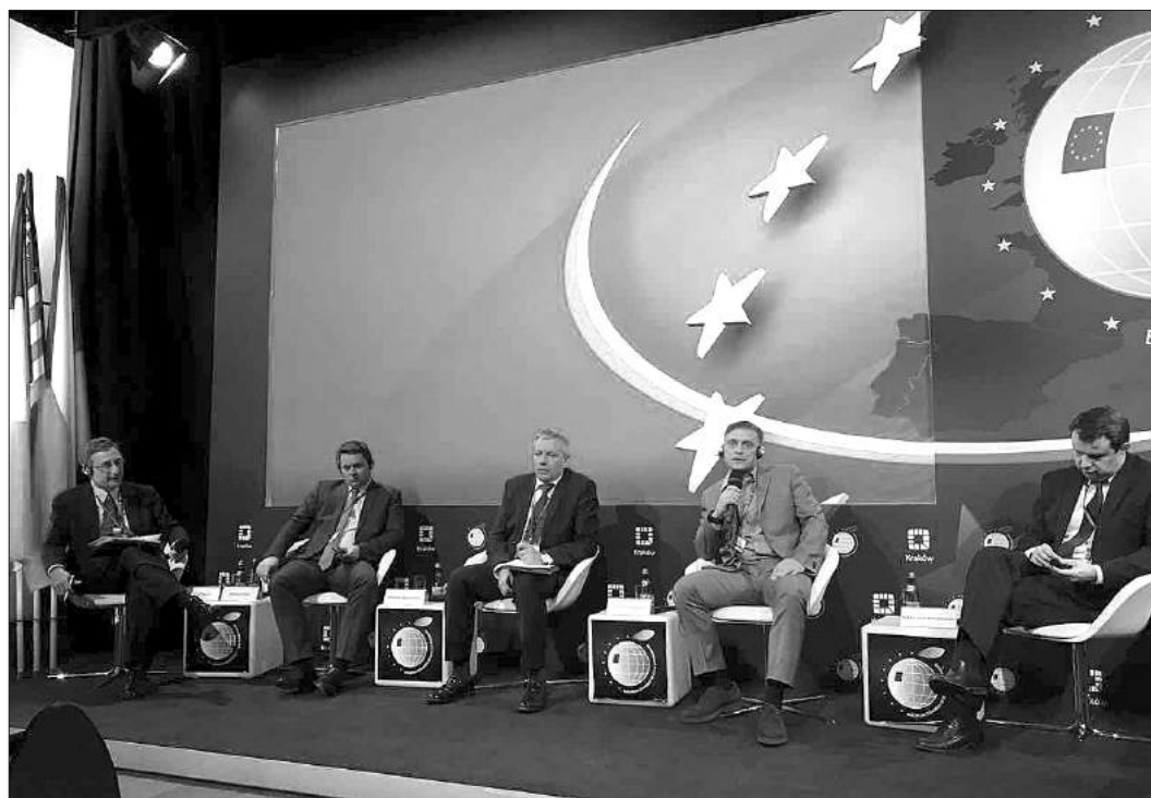
На Краковском конгрессе состоялся обстоятельный обмен мнениями участников.

При этом важно отметить, что нельзя заменить отпуск денежной компенсацией беременным женщинам, лицам в возрасте до 18 лет, работникам, занятым на работах с вредными и (или) опасными условиями труда.