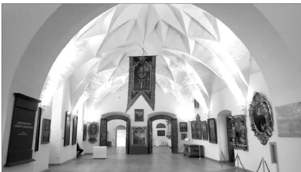
Один из залов музея.

Дело в том, что предназначена она для определения времени весеннего равноденствия. От этого космического явления отсчитывают даты христианских праздников, в частности, Пасхи. (Смычка науки и религии какая-то). Как показали вычисления Коперника, дата весеннего равноденствия была в его времена определена неточно. Посему религиозные праздники наступали не вовремя. Непорядок получается. Правда, устранили