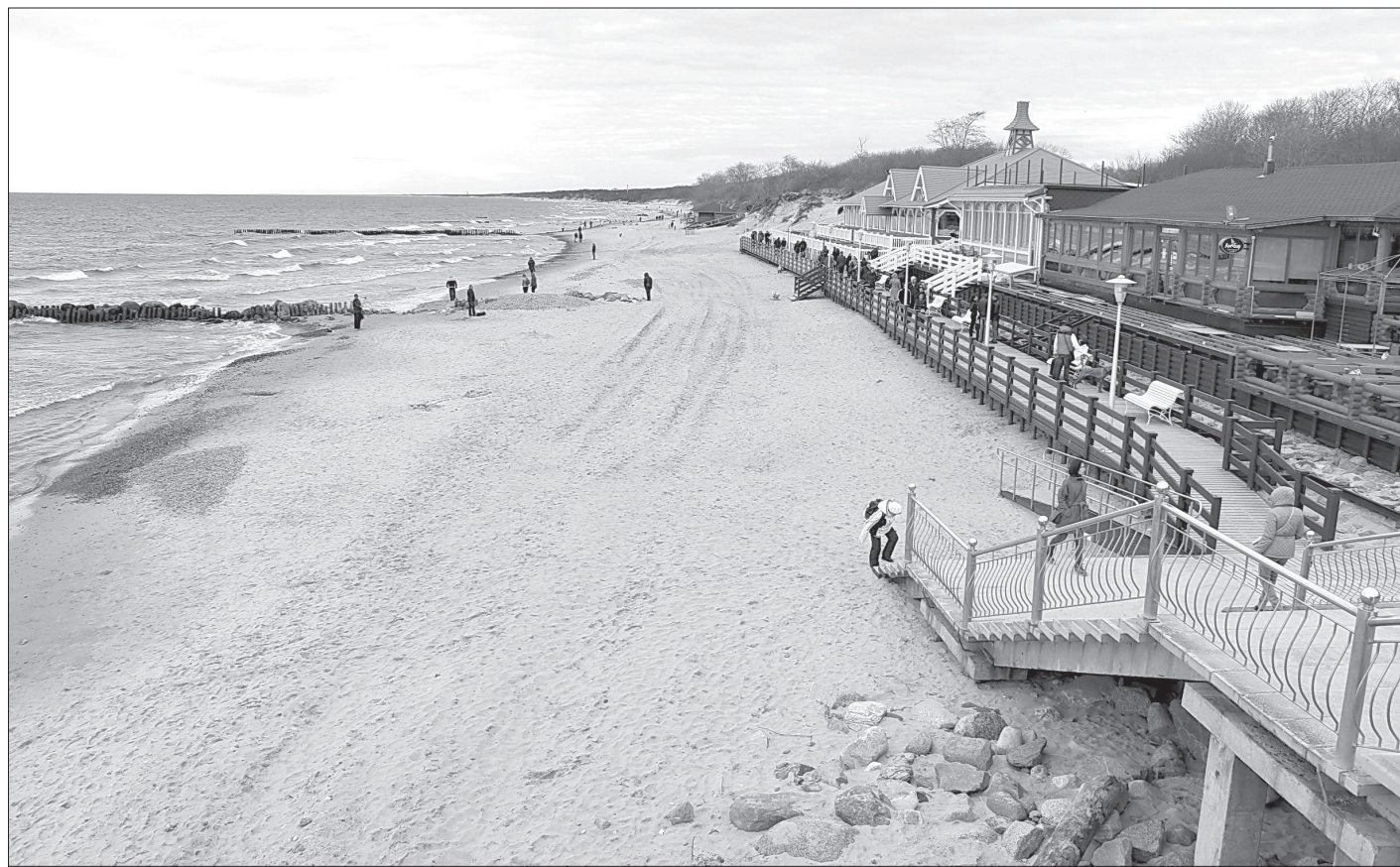
Многие калининградцы, скорее всего, предпочтут провести лето дома. Благо у нас под боком море со Светлогорском и Зеленоградском, Янтарным и Балтийском.

Прошлый год ознаменовался оживлением рынка труда, приростом вакансий (примерно на 10 процентов)