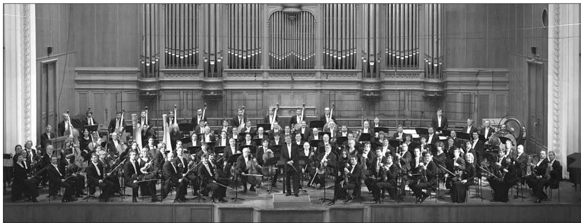
Большой симфонический оркестр имени П. И. Чайковского (Москва). Художественный руководитель и главный дирижер — народный артист СССР Владимир Федосеев.